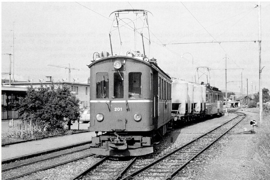
Be 4/4 201 rangiert Silowagen für Matzingen an Zug 31 nach Frauenfeld am 16. Juni 1977.

Der Personenverkehr bot eine deutlich dichtere Zugfolge, immer noch typisch das Mitführen von Güterwagen für den Stückgut- und Ladungsverkehr. Der Güterverkehr, nun ab und bis Wil, war rege, beschränkte sich jedoch im wesentlichen auf die Matzinger Mühle, die Getreide in Bahnbehältern erhielt, und die Webereien in Rosental und Münchwilen. Nur hier beobachtete ich Güterwagen, alle übrigen Anschluss- und Ladegleise waren stillgelegt.