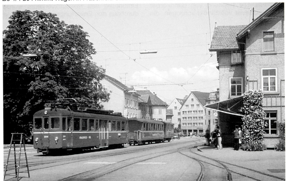
Be 4/4 204 nimmt Wagen in Frauenfeld Stadt auf am 16. Juni 1977.

Der Personenverkehr wird wie eine Städteverbindung im Halbstundentakt abge-