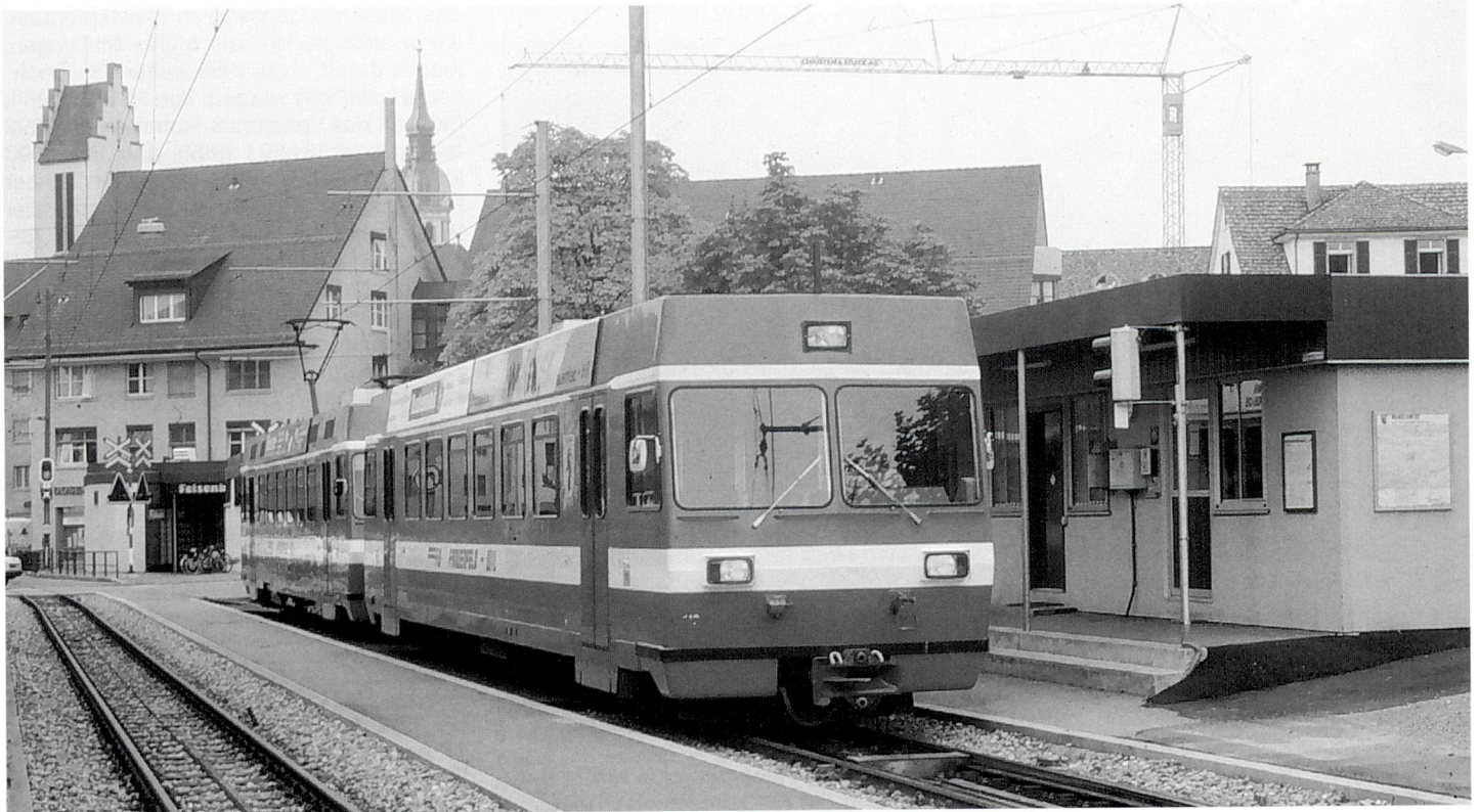
Zug 48 nach Wil. Frauenfeld Stadt, 24. September 1993.