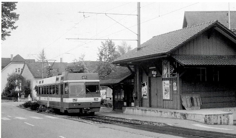
Zug 37 nach Frauenfeld am 24. September 1993.

wickelt, Fahrzeit 32 Minuten; merkwürdig ist der versetzte Halbstundensprung, ausgerichtet auf den vertakteten SBB-Anschlussverkehr in Frauenfeld und Wil. Der Einsatz der neuen Pendelzüge und der Taktverkehr haben den Personenverkehr aus dem Tal (1983: 596 425 Fahrgäste) auf 850 000 Reisende 1990 hochkatapultiert, dem allgemeinen Trend folgend ist allerdings in den letzten Jahren ein merkbarer Rückgang zu verzeichnen (1992: 805 094 Fahrgäste).