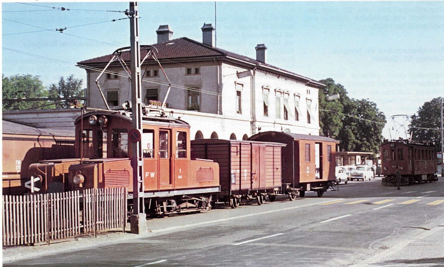
Ge 4/4 7 rangiert Güterwagen zum Umladegleis. Hinten der ABe 4/4 1 an der Abfahrtstelle gegenüber dem SBB-Bahnhof Frauenfeld am 12. September 1962.